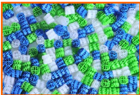
Figuur 1 Foto dragermateriaal

Het MBBR systeem is een slib op drager systeem, waarbij de drager vrij in de bioreactor zweeft. De drager is gemaakt van gerecycled kunststof en heeft een zeer groot oppervlak, zie onderstaande figuur.